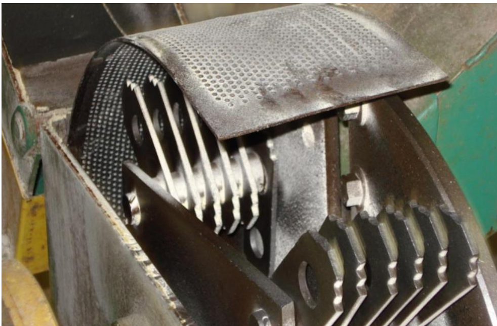
Moinho de martelo com destaque para o encaixe dos martelos junto a peneira.