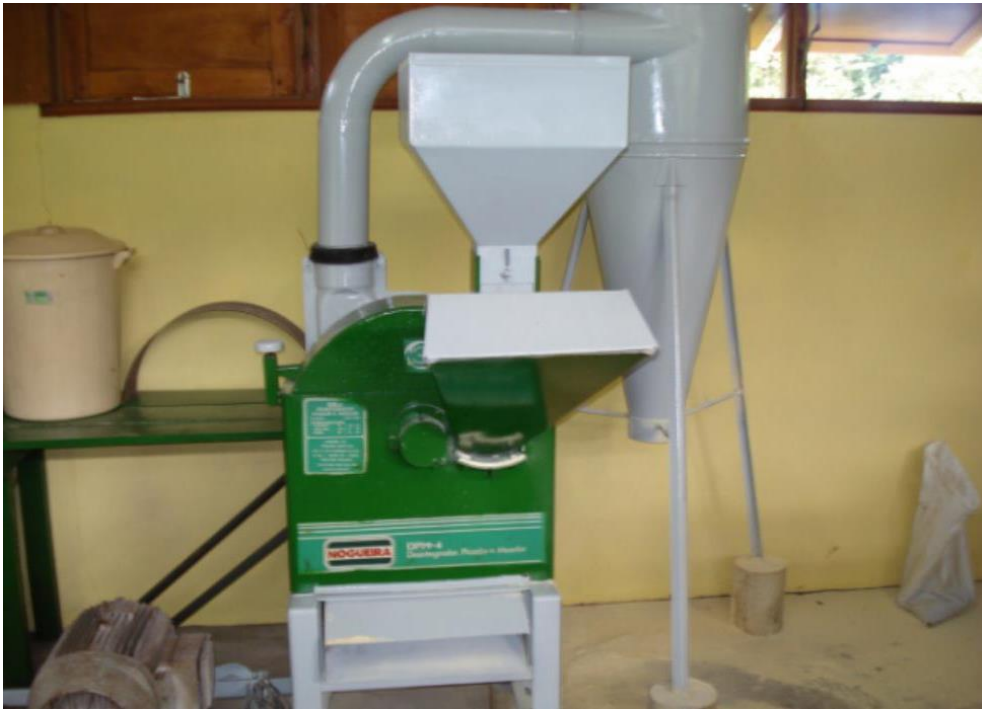
Moinho de martelo com silo de expansão acoplado.