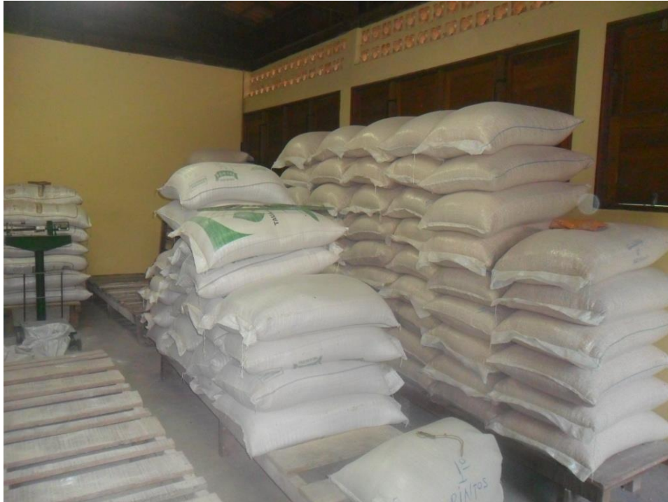
Vista interna de matérias-primas armazenadas em pequena fábrica de ração.