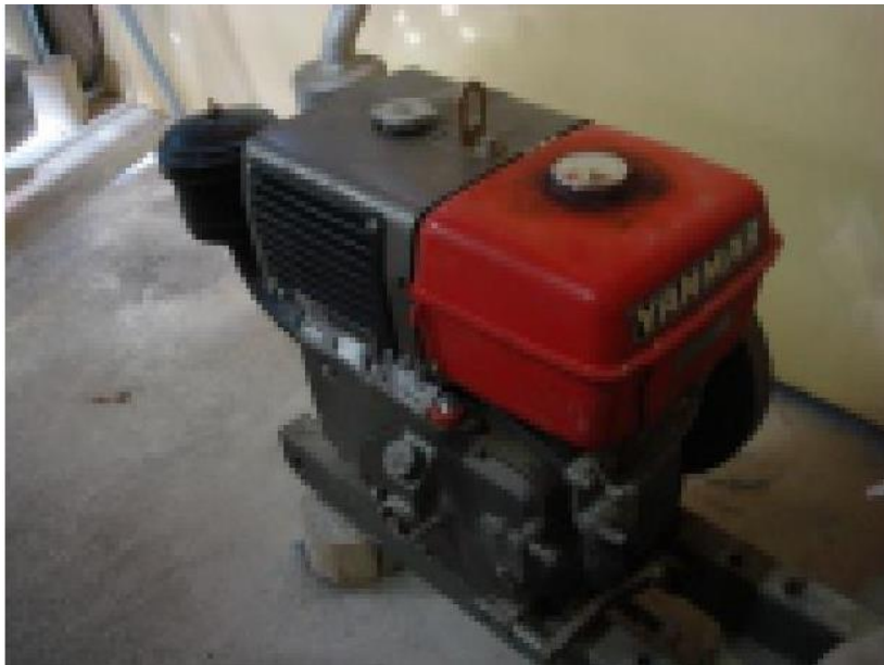
Motor estacionário (diesel).

Recomenda-se que fábrica de ração possua um motor estacionário preferencialmente a diesel, para suprir eventuais faltas de energia elétrica. Salientando-se que esta necessidade é maior para o funcionamento do moinho, já que o mesmo é responsável pela trituração de grãos.