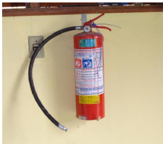
Extintor de incêndio.

Para maior segurança devem existir extintores de incêndio para equipamentos elétricos, dispostos estrategicamente no interior da fábrica de ração.