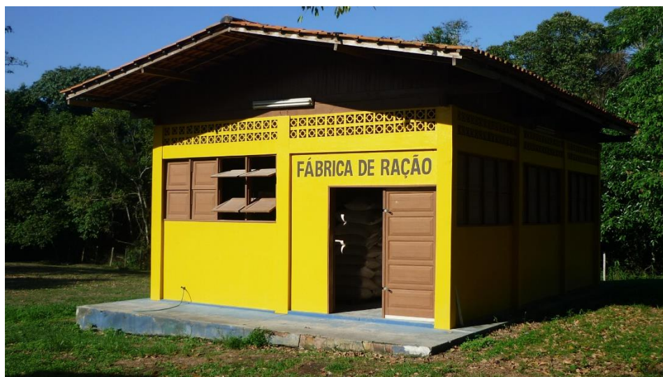
Vista frontal de uma pequena fábrica de ração.