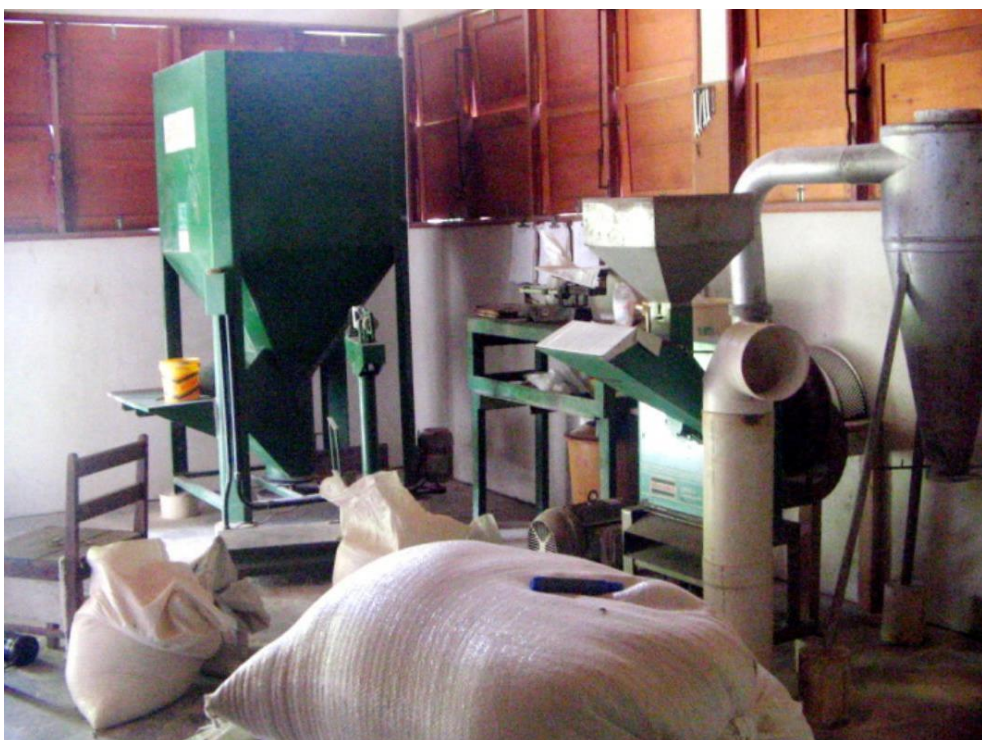
Vista interior de uma pequena fábrica de ração.

Os equipamentos e acessórios básicos que compõem uma pequena ou média fábrica de ração são: moinho (tritador de grãos), misturador de ração, balanças, motor estacionário preferencialmente a diesel, extintor de incêndio, relógio e estrados de madeira. Nas grandes fábricas de ração, além dos equipamentos citados, encontram-se: transportadores, silos, melaceadores, granuladores e ensacadores.