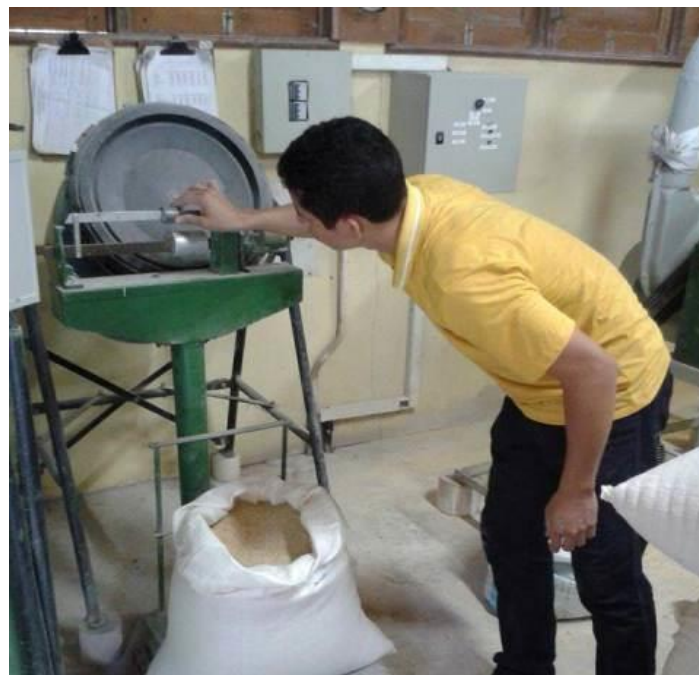
Pesagem em pequena fábrica de ração.