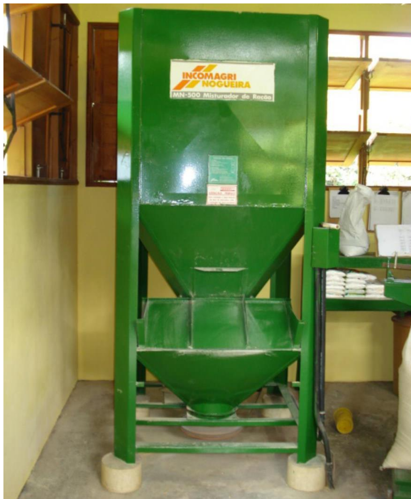
Vista frontal de misturador do tipo vertical.

Nas grandes fábricas utilizam-se misturadores do tipo horizontal e contínuo cujo tempo de mistura varia entre 4 a 5 minutos.