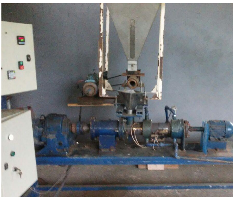
Máquina extrusora para processamento de rações aquícolas em pequena propriedade rural.

Destaca-se ainda que a peletização e a extrusão, mesmo demandando equipamentos mais onerosos (máquinas peletizadoras e extrusoras, respectivamente), é um processamento que pode ser feito na propriedade rural de pequeno e médio porte. E que as rações extrusadas são tidas atualmente como as mais adequadas à piscicultura, principalmente em criações semi-intensivas e intensivas, pois propicia uma avaliação visual do consumo de ração no viveiro, bem como diminui perdas por solubilização para a água, porém seu custo apresenta-se superior ao da peletizada (PASTORE et al., 2012).