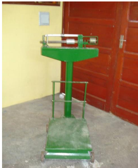
Balança com capacidade para 300 kg (para pequenas e médias fábricas).

Devem existir balanças com escala adequada para pesar as matérias-primas a serem utilizadas na fabricação de rações. Na pesagem das matérias-primas que participam em maior quantidade devem-se utilizar balanças grandes com divisões de 100 gramas. Na pesagem de suplementos vitamínicos minerais e aditivos, que participam em menor quantidade, utilizar balanças menores do tipo digital.