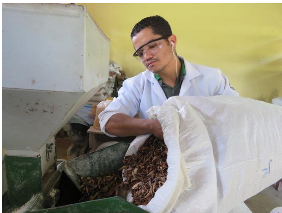
Técnico de rações triturando produto alternativo (resíduo de tucumã) em moinho de martelo.