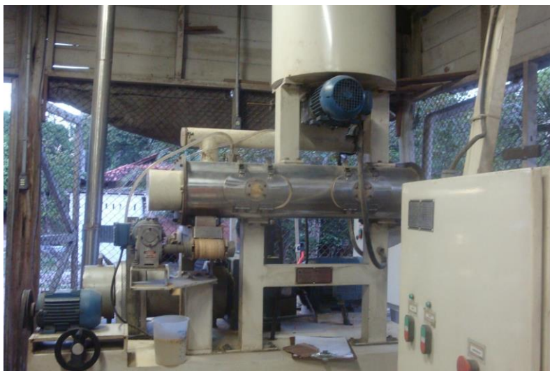
Máquina extrusora para processamento de rações aquícolas.

Vale ressaltar que a escolha da granulometria da ração extrusadas a ser fornecida deve levar em consideração o tamanho dos peixes, sobretudo o tamanho da boca do peixe, para que este consiga capturar a ração e ingeri-la.