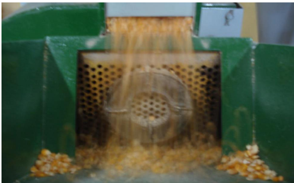
Moinho triturando milho com peça imantada para retenção de objetos de metal.